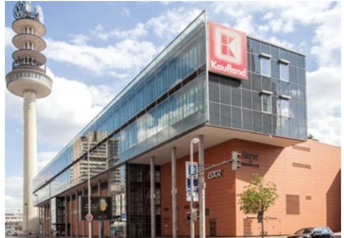
Die FIM Unternehmensgruppe vermietet an Kaufland, Lidl, Rewe und andere namhafte Handelsfirmen.

Dieses führt zu Einkaufspreisen, welche auch Mitbewerber staunen lassen.